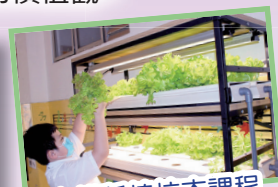
水耕種植校本課程

小小科學家；LEGO 樂高小小建築師；VDO English / Booth game