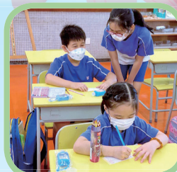
小五義工正指導小一學弟繪畫禪繞畫