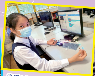
應用 Micro:bit 進行編程教育