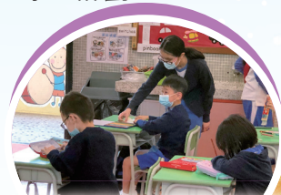
高年級學生入班進行有心計劃的義工服務，教授低小同學繪畫禪繞畫。