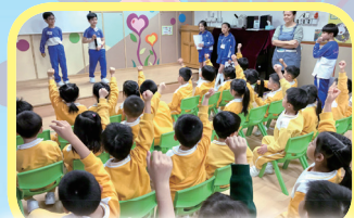
成長的天空學生探訪幼稚園，與幼稚園生一同愉快地遊戲。