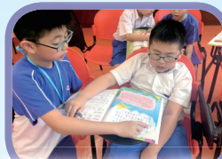
小導師在「助人起行」計劃中耐心地與小妹溫習英文生字。