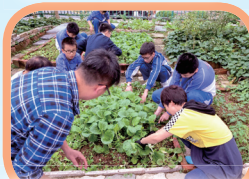
協助德德市集的學生聽從工友的教導，認真地收割有機農作物