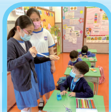
義工姐姐為小弟弟貼上貼紙，點綴酒精搓手液的包裝。