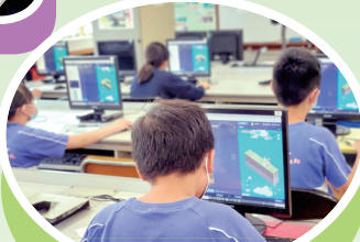
STEM 編程 python 課程