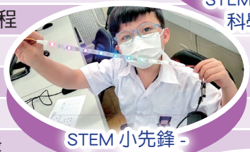
STEM 小先鋒 - micro:bit 編程