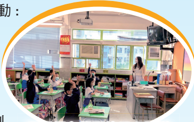
同學們在學習使用心靈樽進行靜觀活動。