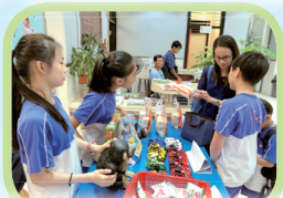
德德市集開賣，委員都積極向家長及學生叫賣。