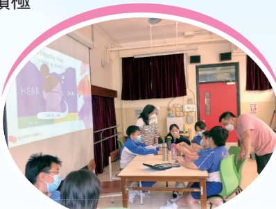
學生大使正利用「同理心地圖」代入角色，反思在遇到逆境時會有的反應。