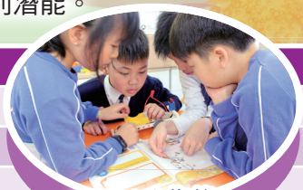
STEM 小先鋒 - 科學探究