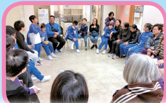
親子義工在中途宿舍與宿友交流，了解復健人士的生活狀況