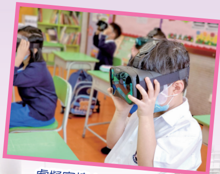
虛擬實境 (VR) 互動學習