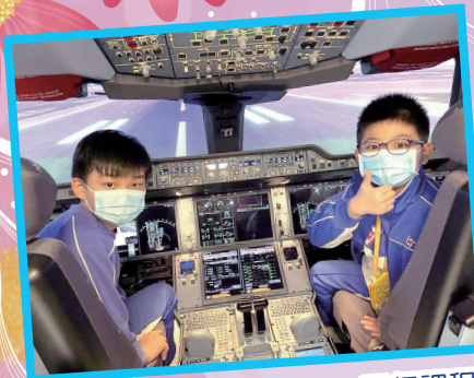
香港航空訓練大樓 STEM 飛行課程