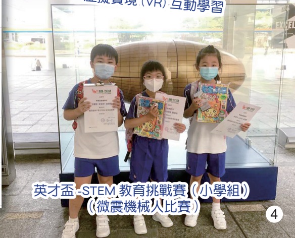
英才盃-STEM 教育挑戰賽（小學組） （微震機械人比賽）