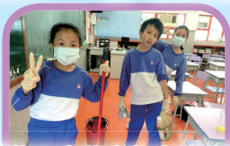
成長的天空學生努力地清潔校園，保持整潔的學習環境。