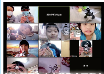
低小同學在小小藝術家課程中創作輕黏土公仔。

本校以「全校參與支援模式」，組成支援組，支援及照顧有特殊學習需要的學生。本年度學校為有需要的學生提供以下支援服務：